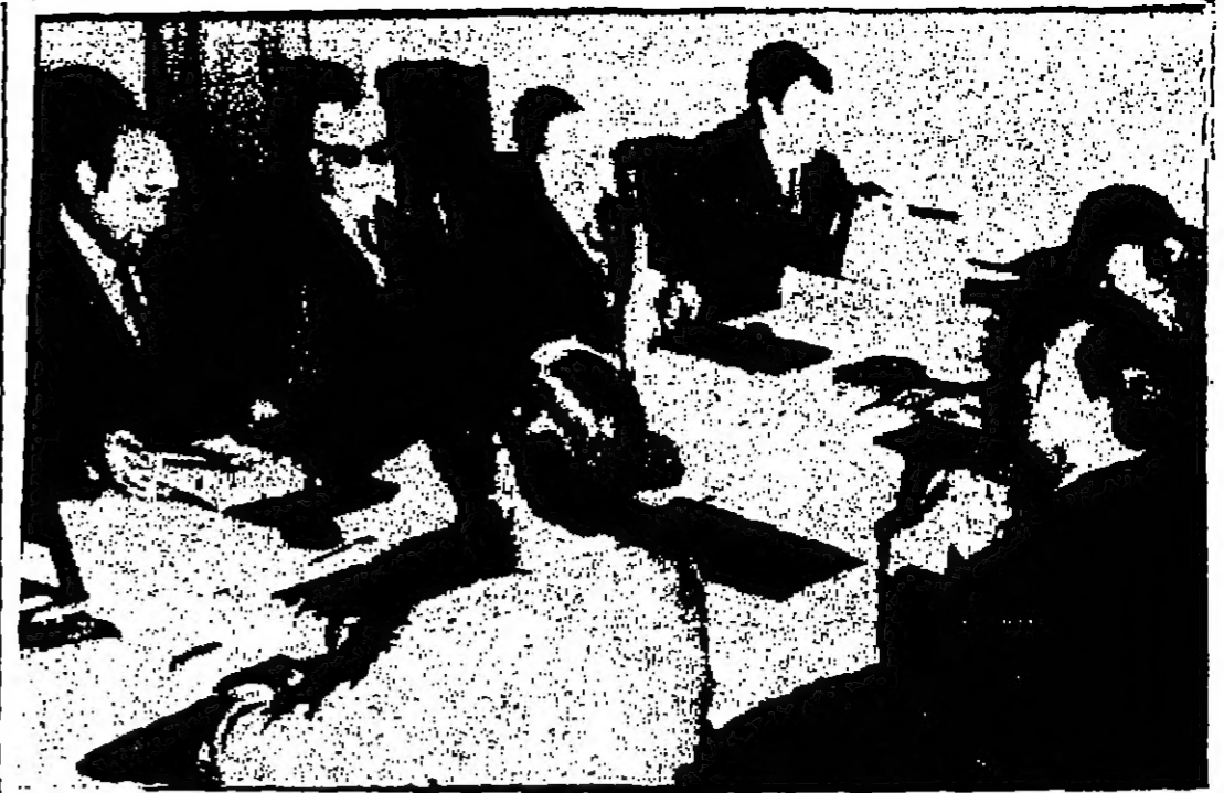
الاجتماع الذي حضره امين اتحاد القويين القوميين الذي عقد في منزل الرئيس الفلسطيني محمد ايوب خان بين باكستان وتركيا وايران